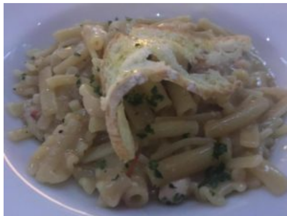
Mischiato di Gragnano, ragù di pesce di scoglio, molluschi e crostacei con chips di pane all'aglio

Omaggio a Gragnano, città della pasta per il primo piatto: mischiato di Gragnano, ragù di pesce di scoglio, molluschi e crostacei con chips di pane all'aglio.