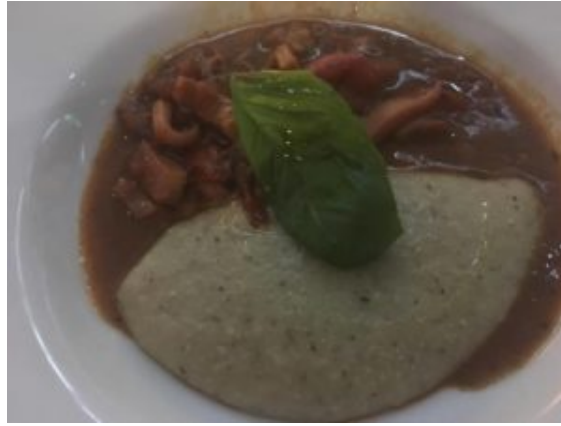
Zuppetta di seppie e maracucciata di Lentiscosa

che ha permesso agli ospiti di scoprire una ricetta ignota ai più.