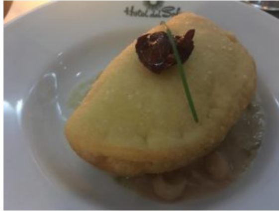
Raviolo fritto al baccalà e gambero rosso con zappetta di fagioli di Controne

Omaggio a Gragnano, città della pasta per il primo piatto: mischiato di Gragnano, ragù di pesce di scoglio, molluschi e crostacei con chips di pane all'aglio.