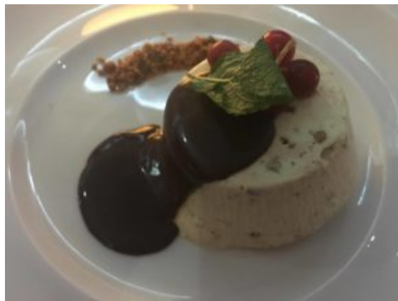
Semifreddo al torroncino degli sposi

Perfetto il dolce: il semifreddo al torroncino degli Sposi di Roccagloriosa dell'Azienda Cavalieri è stato davvero un'eccezionale conclusione.