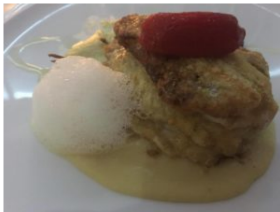
Parmigiana bianca di alici, provola affumicata, passamani di ceci e pomodoro confit con aria di timo e limone

A partire dall'antipasto: alice 'nchiappata (ricotta di bufala e crema di peperoni e pomodoro di Mandia dell'Azienda Ermmà); parmigiana bianca di alici, provola affumicata, passatina di ceci e pomodoro confit con un'aria di timo e limone;