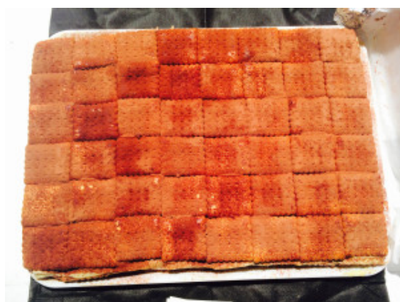
Torta di gallette

e l'ormai famosa torta di gallette di Enza Cicalese, compagna di Luca con la passione per la pasticceria tradizionale.