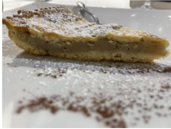
Crostata di castagne