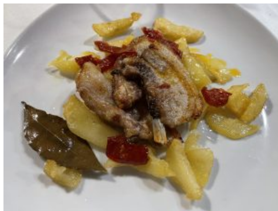
Sfritto di maiale con patate e papacella

Sold out per un affascinante viaggio giallo sui luoghi di Basilicata attraverso i passi di Viola Guarino. Pubblico interessato e curioso per un'autrice capace di coniugare la scrittura attraverso diverse forme.