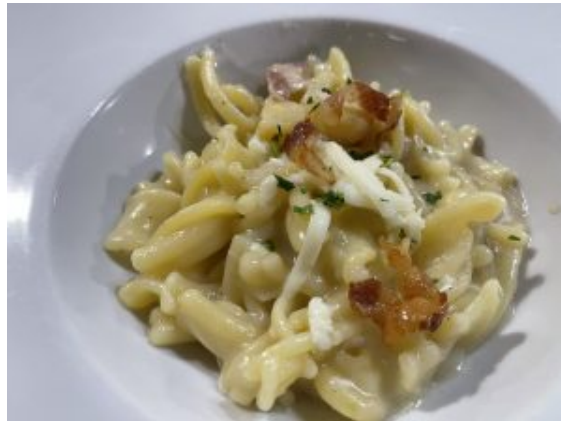
Pasta, patate e pancetta

Una serata impressa nel cuore, nella mente e nel palato, quella dello scorso 20 ottobre.