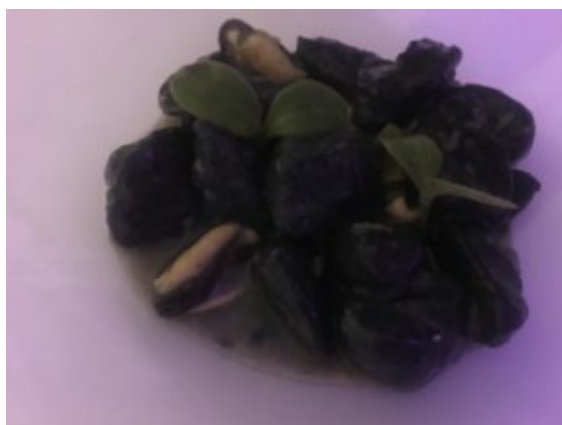
Villa Zaira, Gli gnocchi al nero di seppia

Per farlo, l'arduo compito è stato affidato al "glamour chef" Maurizio Di Ruocco che ha tratto dalla sua "Sea recipe", gnocchetti..., una cavigliera di sassolini di onice nero intervallati da due piccole pepite in oro e brillanti di forma ovoidale, richiamo lieve e non esplicitato ai molluschi marini.