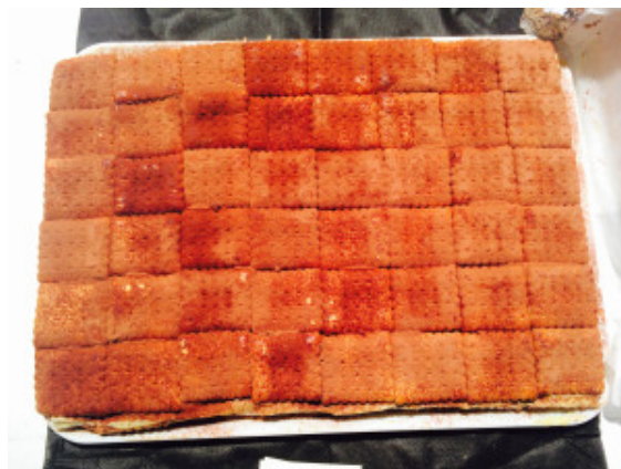
Torta di gallette

e l'ormai famosa torta di gallette di Enza Cicalese, compagna di Luca con la passione per la pasticceria tradizionale.